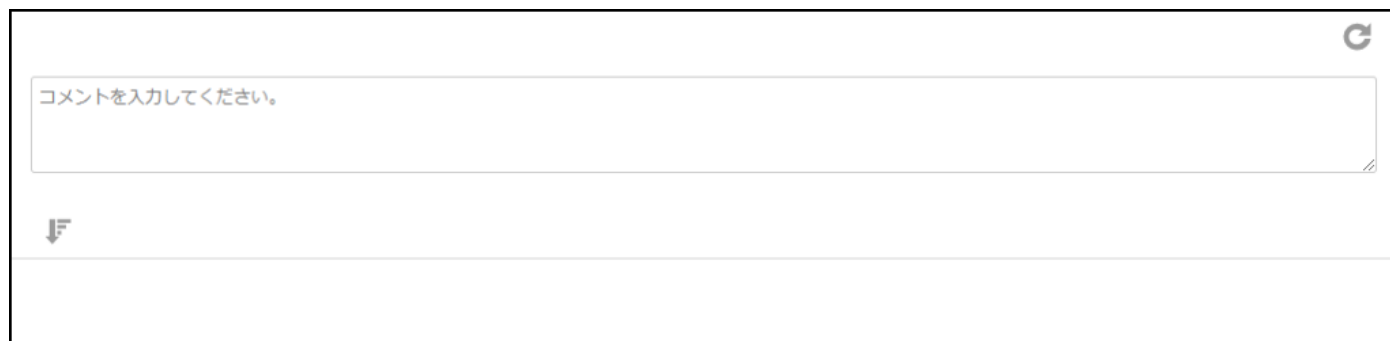
図: 履歴・コメントモジュール