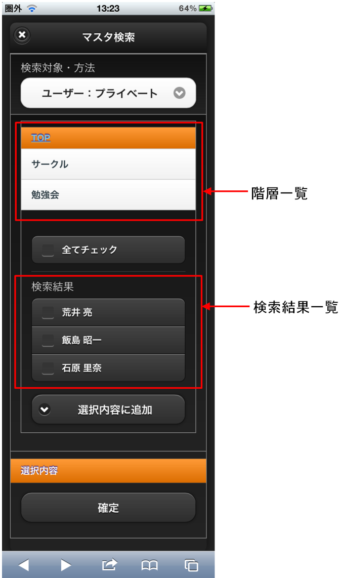
【図：ユーザ検索（プライベートグループ）タブ 画面表示】