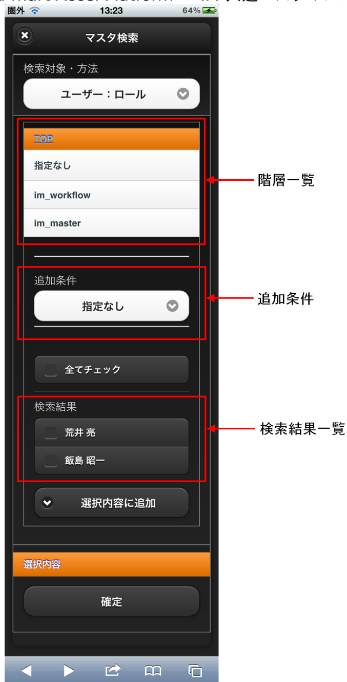
【図：ユーザ検索（ロール）タブ 画面表示】