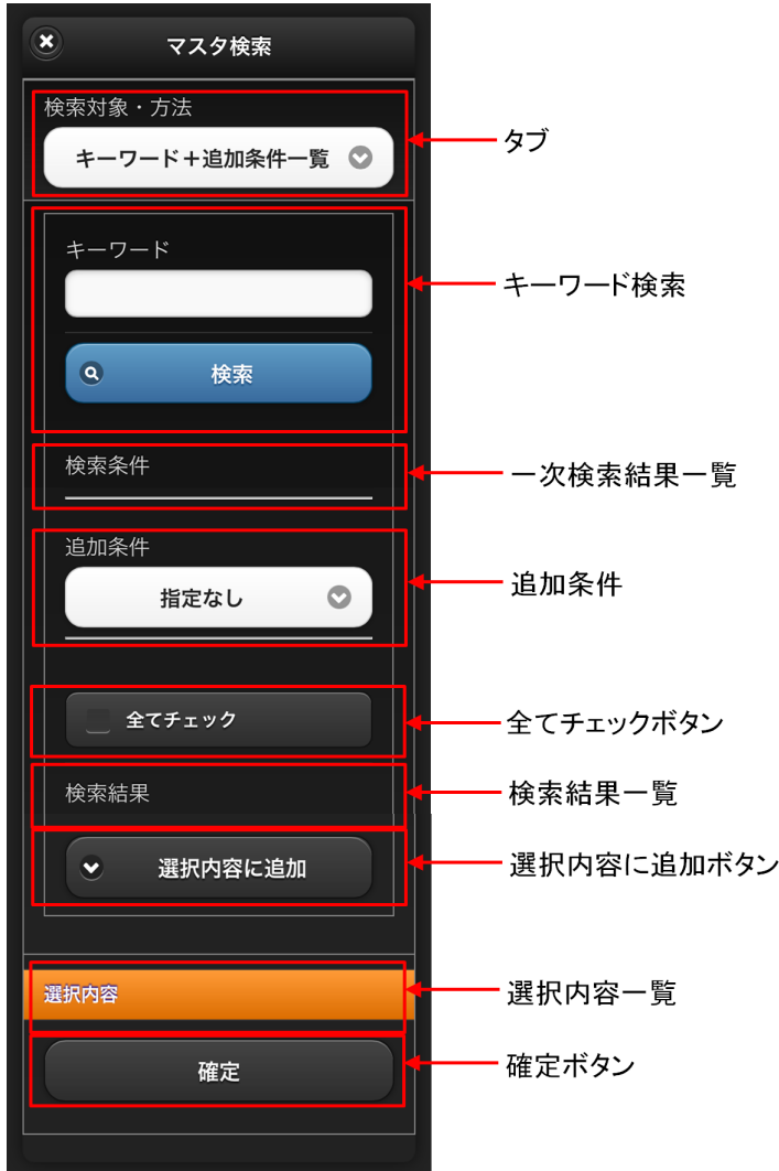
【図：キーワード+追加条件一覧】