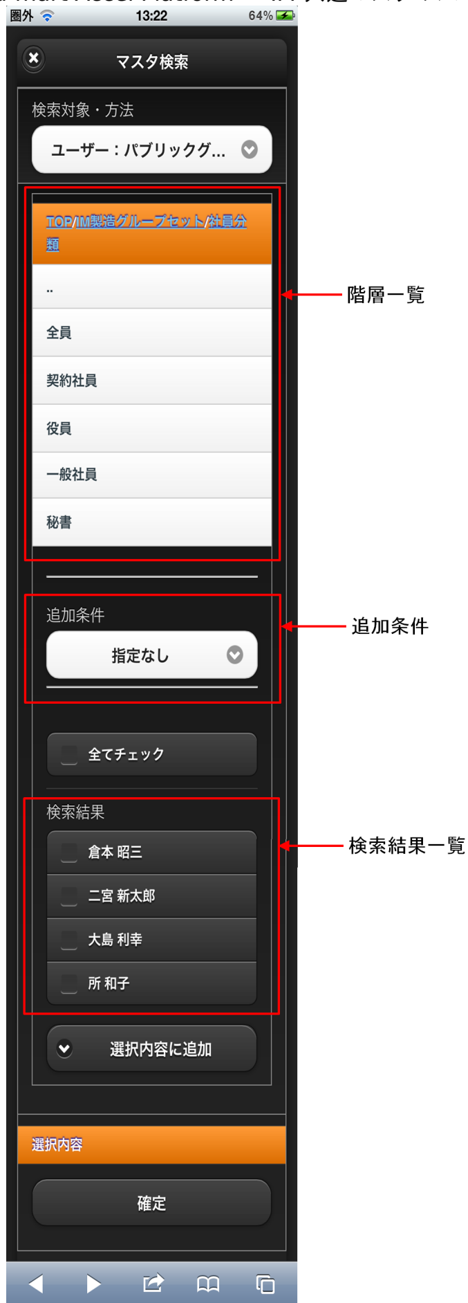
【図：ユーザ検索（パブリックグループ）画面表示】