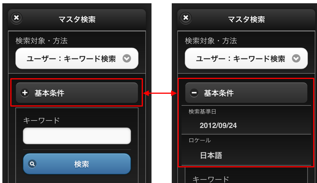
【図：基本情報描画領域】