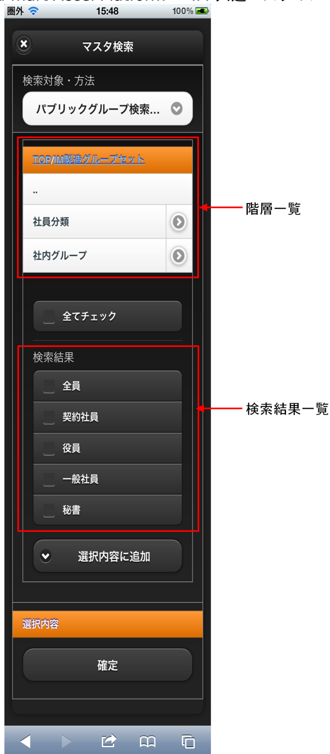
【図：パブリックグループ検索タブ 画面表示】