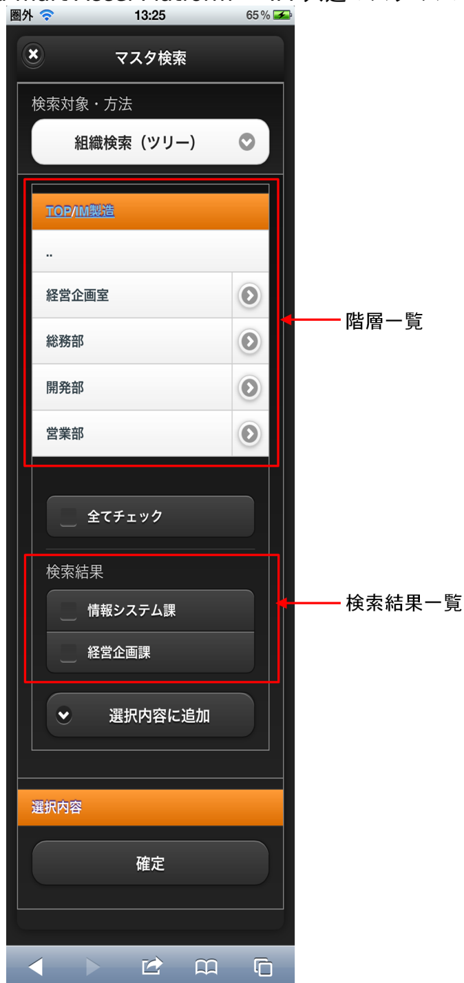
【図：組織検索タブ 画面表示】