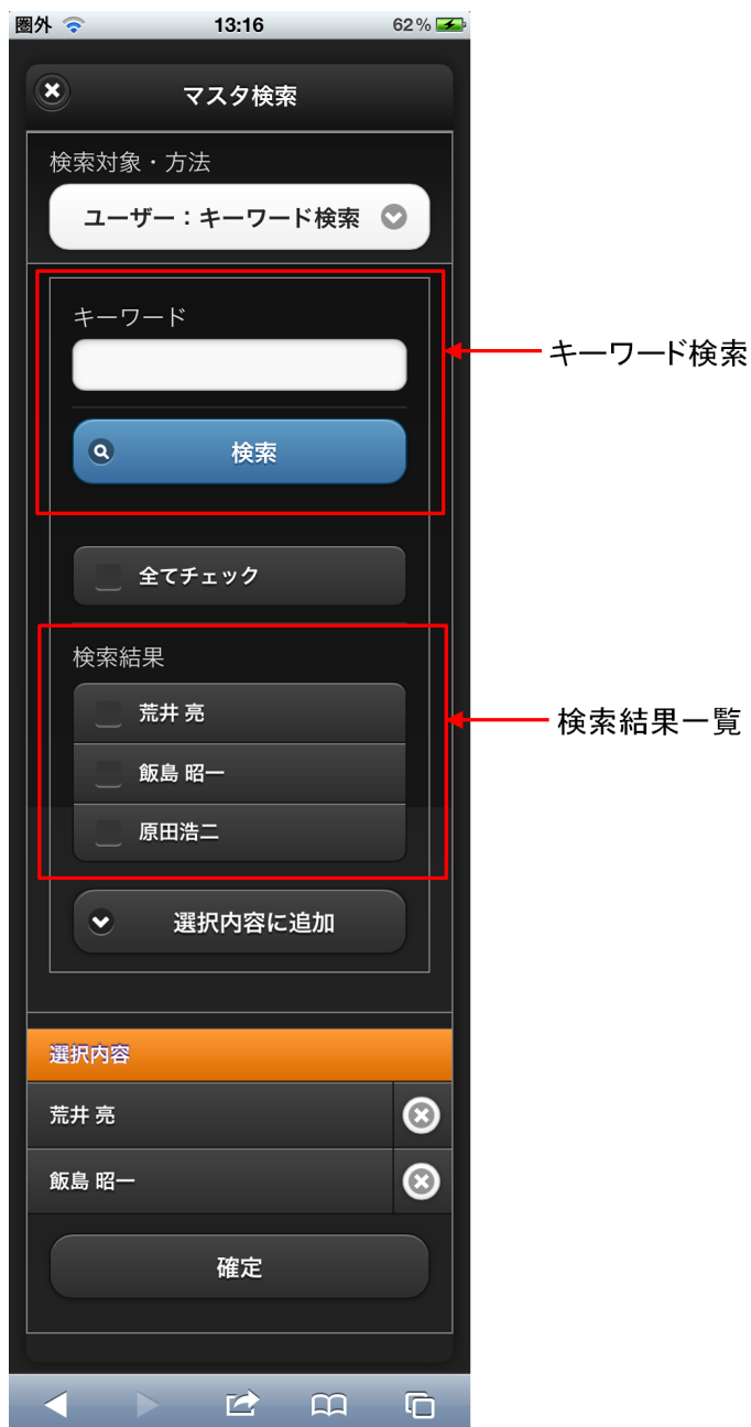
【図：ユーザ検索（キーワード）タブ 画面表示】