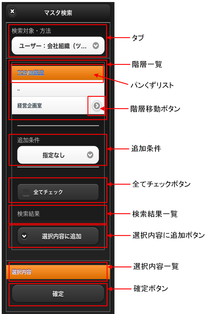
【図：階層+追加条件一覧】