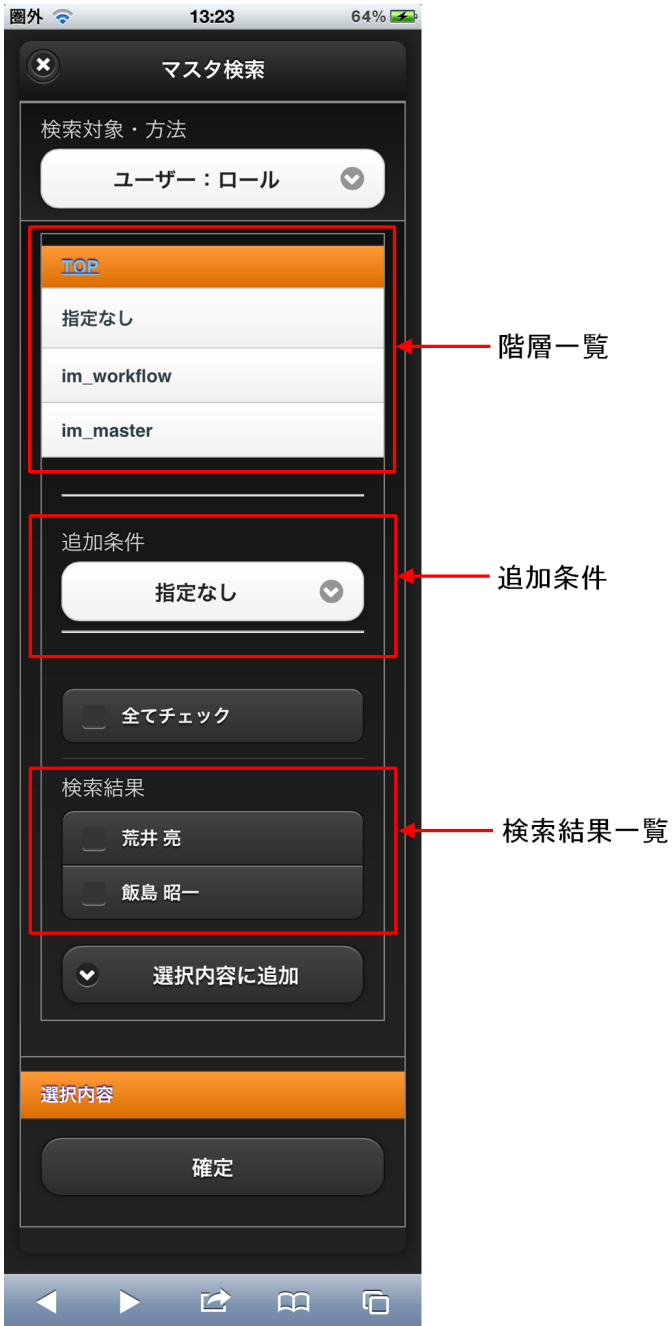
【図：ユーザ検索（ロール）タブ 画面表示】