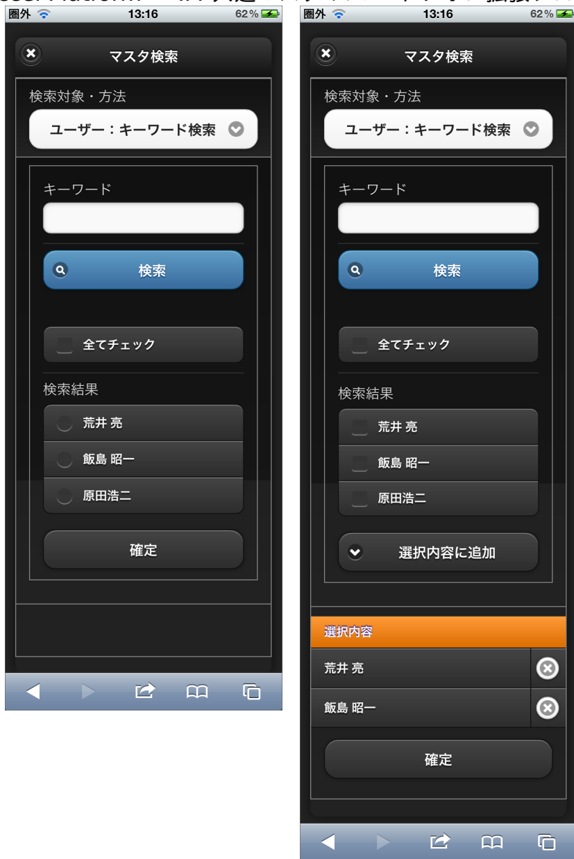
【図:単一選択モードと複数選択モード】