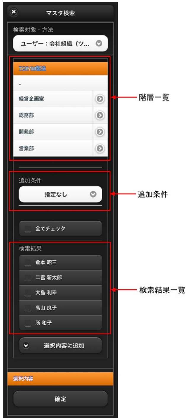
図 4-2 ユーザ検索(組織)タブ 画面表示