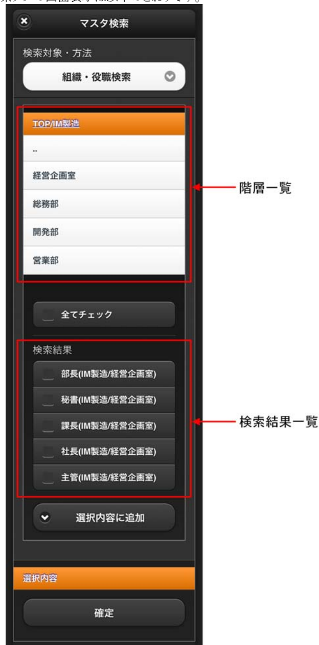
図 4-10 組織・役職検索タブ 画面表示