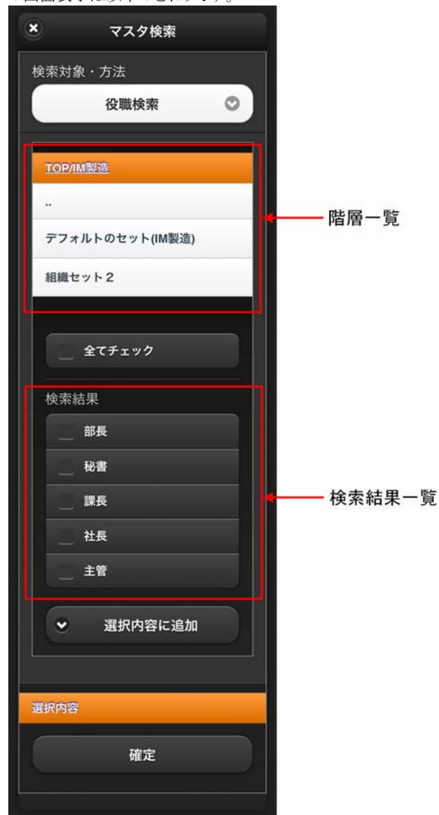
図 4-9 役職検索タブ 画面表示