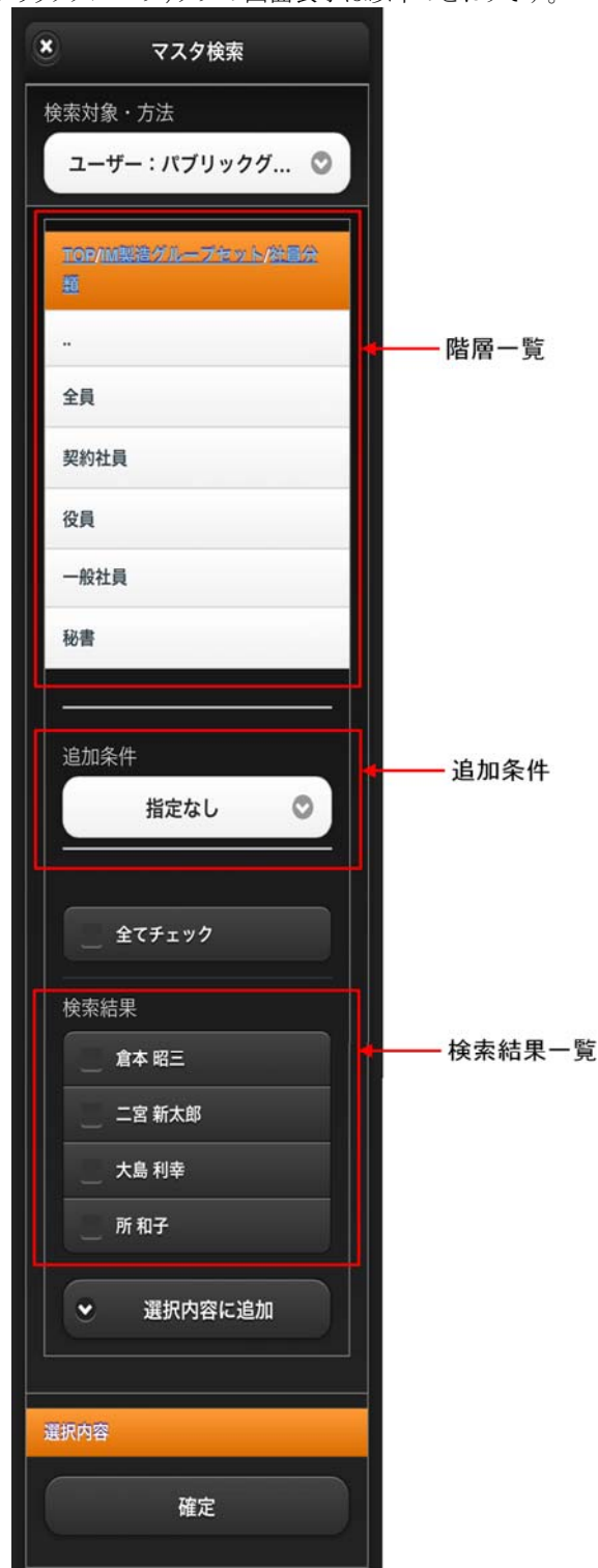
図 4-3 ユーザ検索(パブリックグループ) 画面表示