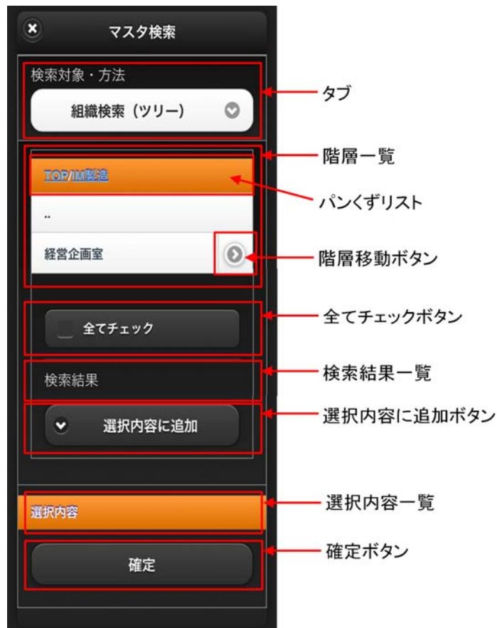
図 2-2 階層