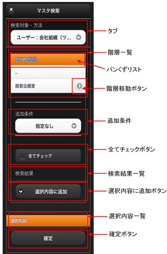
図 2-4 階層+追加条件一覧