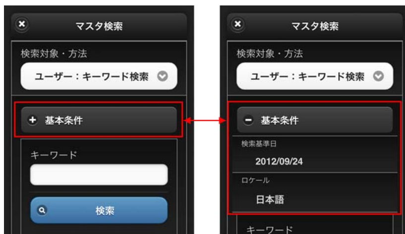
図 3-1 基本情報描画領域

スマートフォン版検索画面における基本情報描画領域は、PC版と異なりpluginで提供しておりません。画面起動引数の基本情報描画領域を指定して表示／非表示を切り替えます。基本情報描画領域を表示した場合、検索基準日などの表示を「基本条件」をタップすることで、展開／縮小を切り替えることができます。基本情報描画領域を表示したときの画面は下図のとおりです。