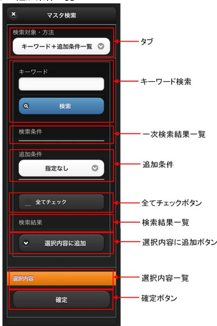
図 2-3 キーワード+追加条件一覧