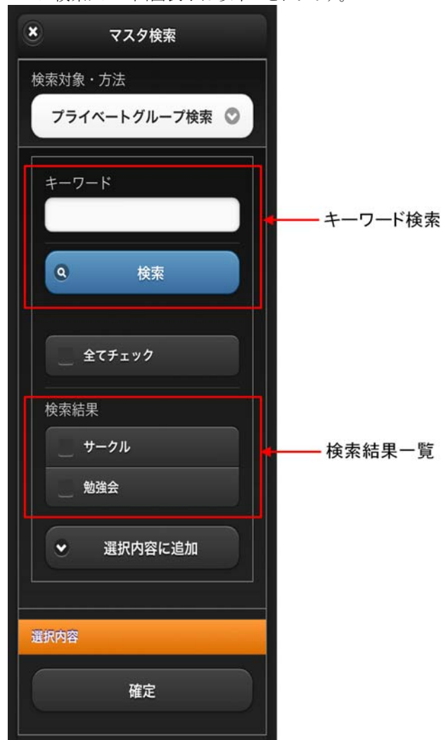
図 4-8 プライベートグループ検索タブ 画面表示