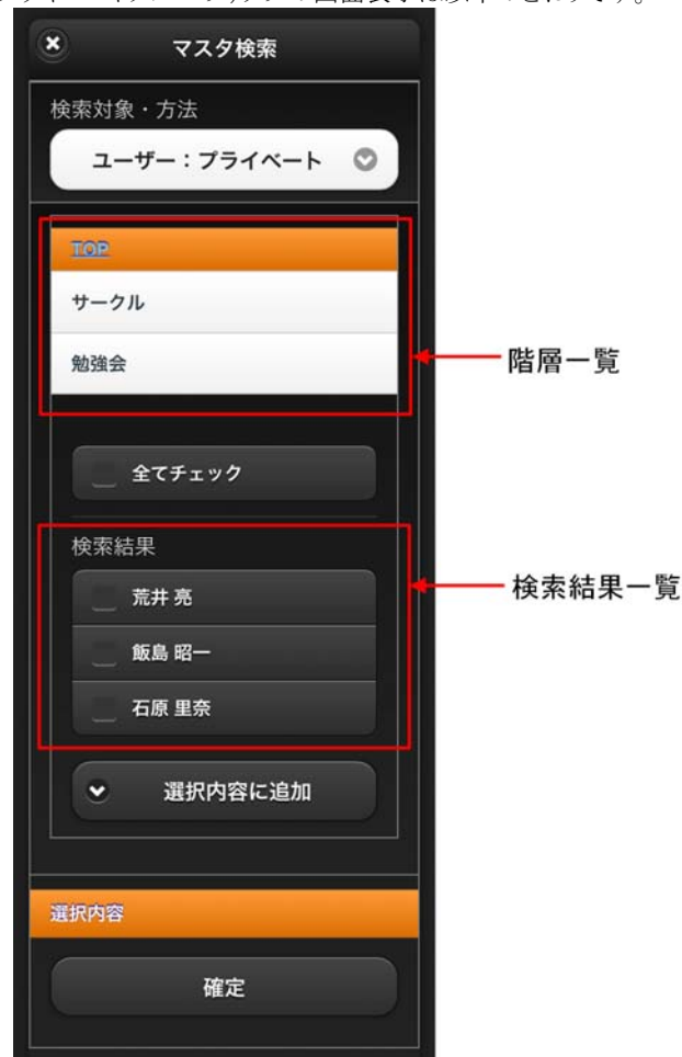
図 4-4 ユーザ検索(プライベートグループ)タブ 画面表示