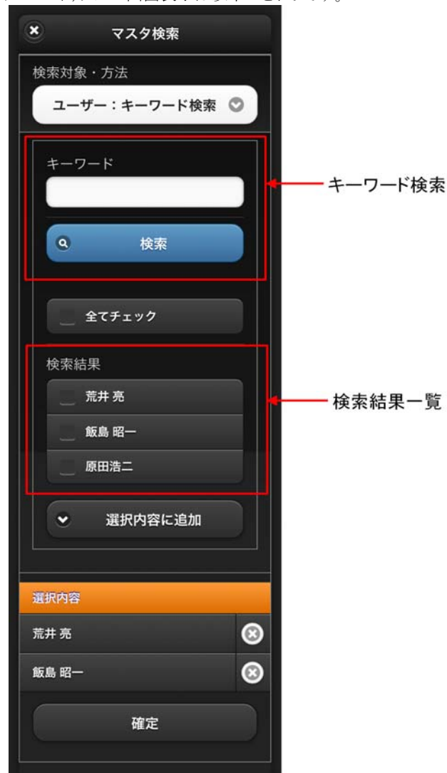
図 4-1 ユーザ検索(キーワード)タブ 画面表示