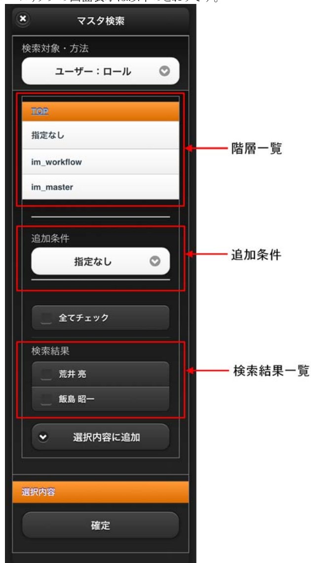
図 4-5 ユーザ検索(ロール)タブ 画面表示