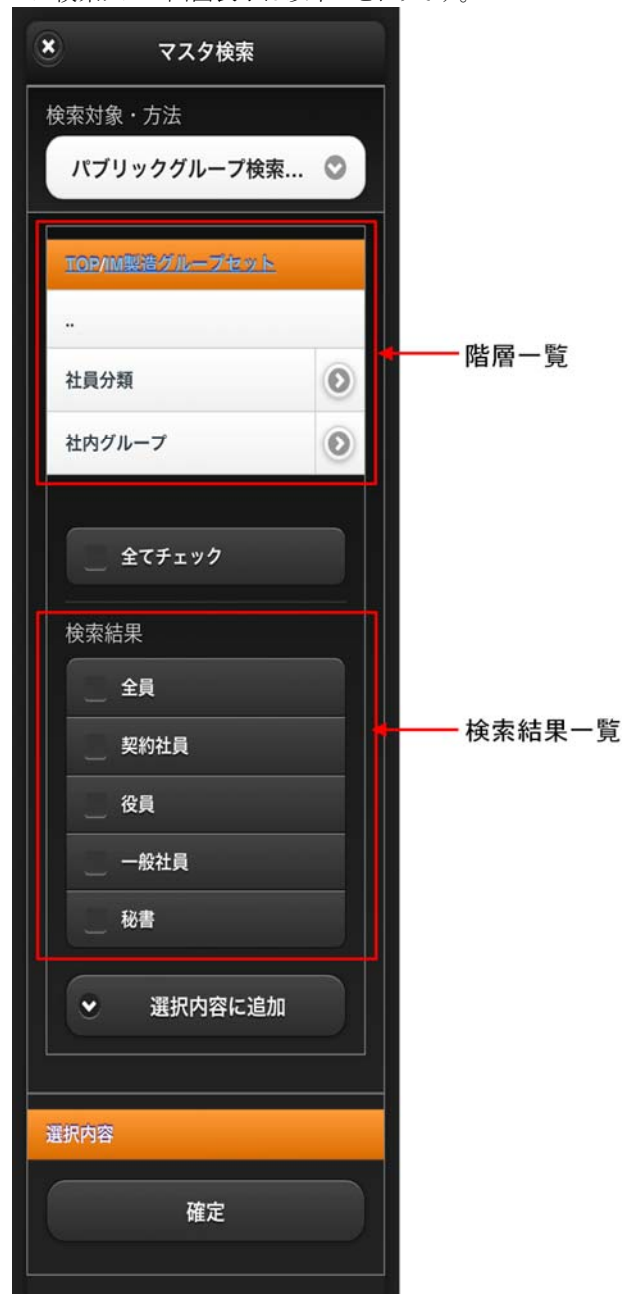
図 4-7 パブリックグループ検索タブ 画面表示