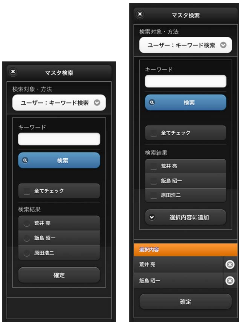
図 2-2 単一選択モードと複数選択モード